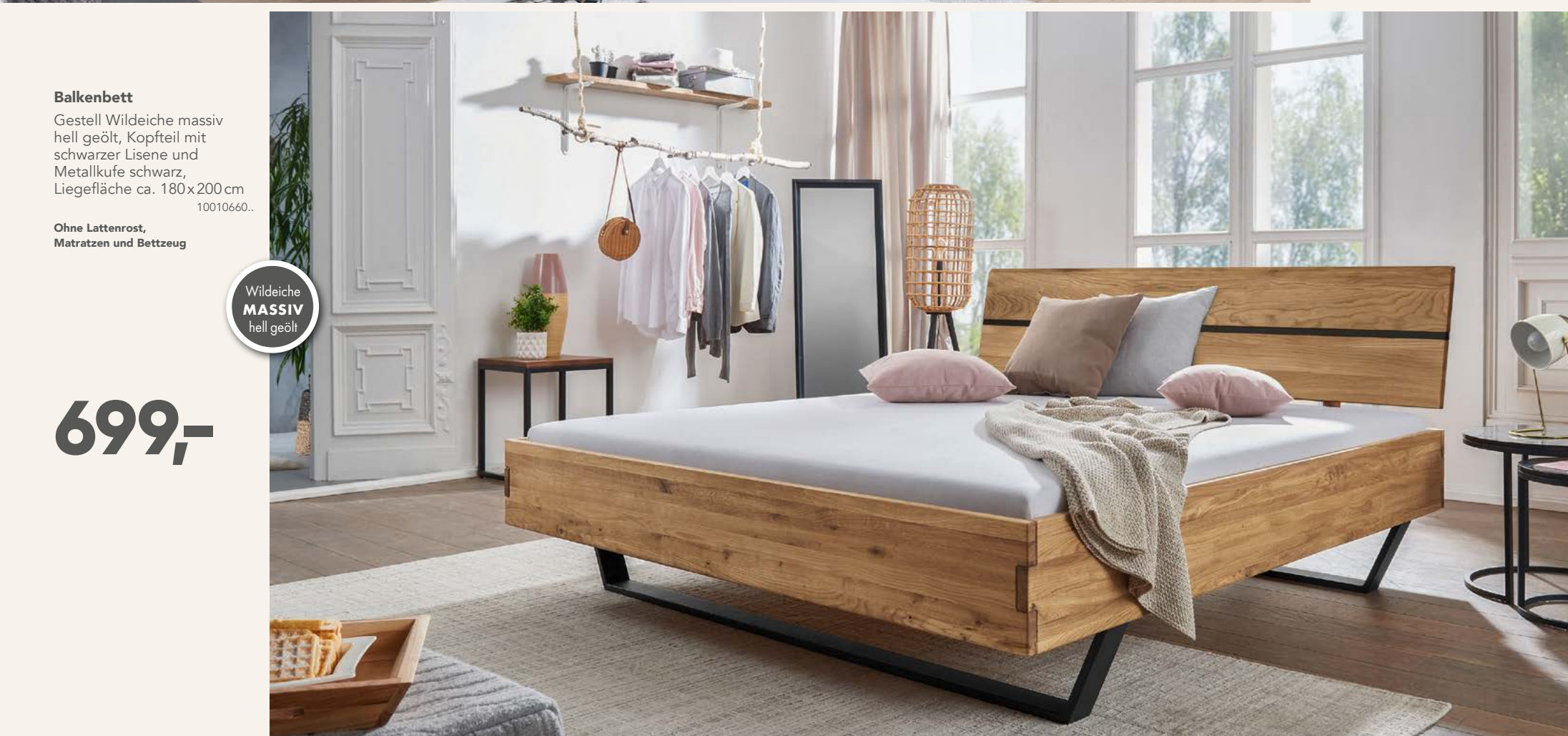
Balkenbett Gestell Wildeiche massiv hell geölt, Kopfteil mit schwarzer Lisen und Metallkufe schwarz, Liegefläche ca. 180x200 cm 10010660..