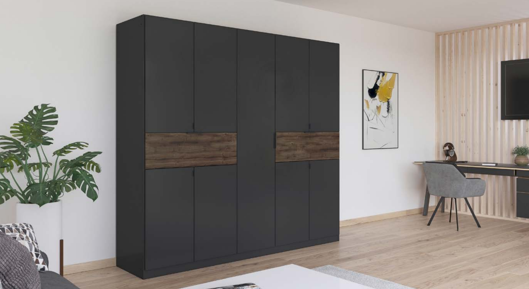
Drehtürenschränk grau metallic / Atlantic Oak-Nachbildung dunkel, ca. B 226 / H 210 / T 54 cm 10010271.0.