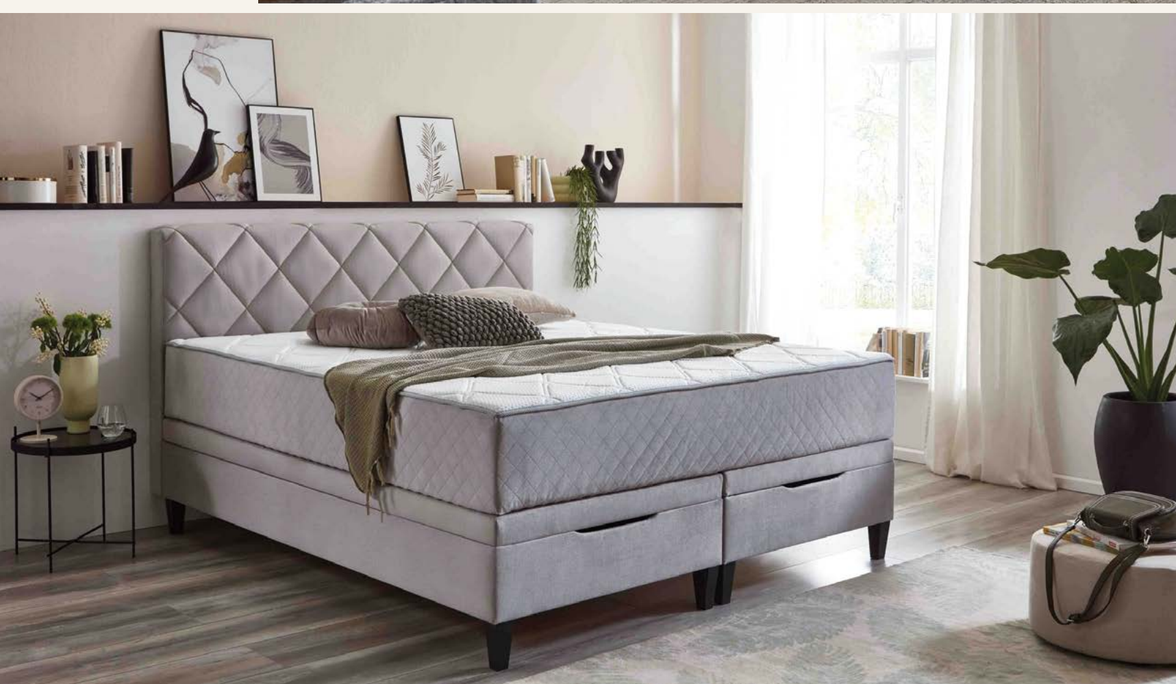
Boxspringbett Bezug silberfarbig, 100 % Polyester, ca. B 180 / H 114 / T 213 cm, Liegefläche ca. 180x200 cm, inkl. Topper, ohne Plaid und Kissen 10011612