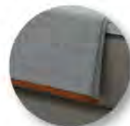
Typ 100 Plaid Klassik Kanten mit Einfassband paspeliert