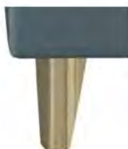
W016-10 W016-15 Holzfuß Wildeiche preisgleich