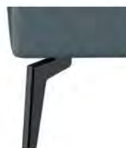
W010-10 W010-15 Metallfuß schwarz preisgleich