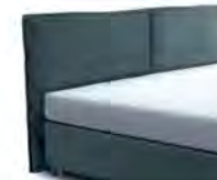
24028 Höhe 116 cm gegen Aufpreis