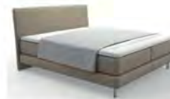
Typ 100 Plaid Klassik komplett geöffnet deckt die Liegefläche nicht ab.

Bitte bei Bestellung (vor allem Einzel- oder Nachbestellung) immer die Bettmaße angeben. Die angegebenen Maße sind ca. Maße. Geringfügige Maßabweichungen zur Liegefläche plus Volanthöhe sind produktionsbedingt