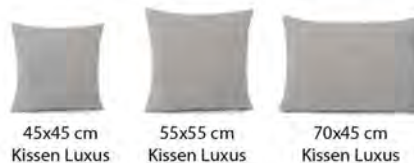
45x45 cm Kissen Luxus