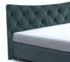
24024 Höhe 128 cm gegen Aufpreis