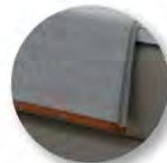
Typ 100 Plaid Klassik Kanten mit Einfassband paspeliert