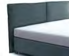
24028 Höhe 116 cm gegen Aufpreis