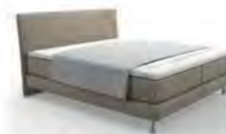
Typ 100 Plaid Klassik komplett geöffnet deckt die Liegefläche nicht ab.

Bitte bei Bestellung (vor allem Einzel- oder Nachbestellung) immer die Bettmaße angeben. Die angegebenen Maße sind ca. Maße. Geringfügige Maßabweichungen zur Liegefläche plus Volanthöhe sind produktionsbedingt