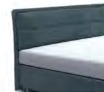
25047 Höhe 116 cm nicht möglich mit LR28Q gegen Aufpreis