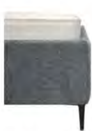
kubisch Höhe ca. 29 cm Standard