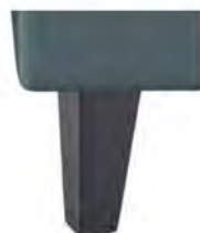
W016-10 W016-15 Holzfuß schwarz preisgleich