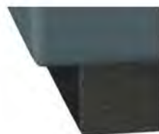
S01-10 S01-15 Bettsockel schwarz Standard