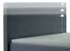
0300 Multimaß Höhe 80 - 125 cm in 5cm-Schritten kürzbar gegen Aufpreis