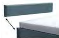
Kopfteilblende 3029 - Höhe 29 cm 3035 - Höhe 35 cm