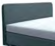
24027 Höhe 116 cm