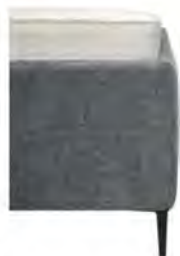
kubisch Höhe ca. 35 cm preisgleich