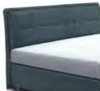
25047 Höhe 116 cm