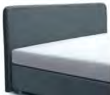
24027 Höhe 116 cm