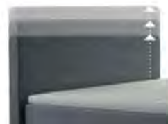
0300 Multimaß Höhe 80 - 125 cm in 5cm-Schritten kürzbar gegen Aufpreis